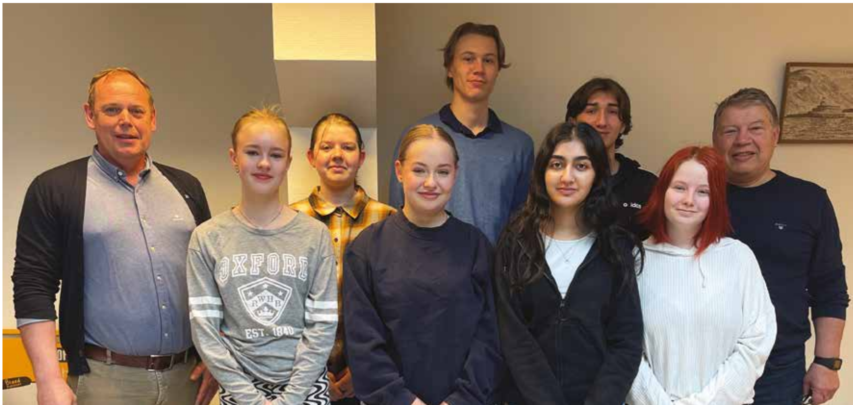
Flankert av kommunens to siste ordførere samlet (nesten) hele ungdomsrådet i Frogn seg før sommeren. Flere aktuelle saker skal behandles i høst.