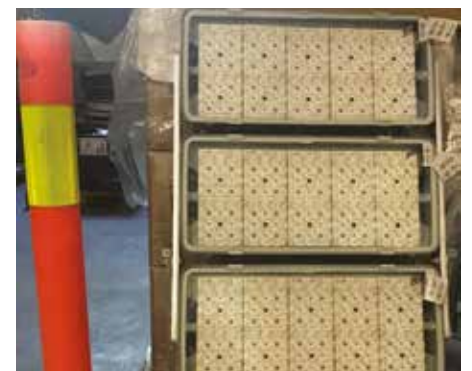
Bildet av ett av armaturene viser hvor store de er. Disse skal det være ca. 44 stk av!